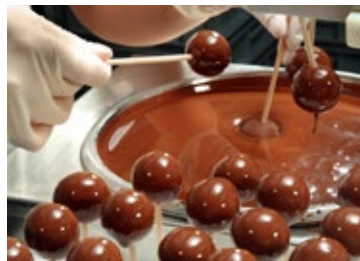
Heute wie vor 130 Jahren: Jede Kugel steckt einmal auf einem Holzstäbchen.

Die originale Mozartkugel hat sich auch deshalb einen Namen gemacht, weil sie über all die Jahrzehnte hinweg ein authentisches Produkt geblieben ist. Ein Produkt, das Grenzen kennt. Eine ist die Haltbarkeit von etwa sechs bis acht Wochen, die nicht durch künstliche Zusatzstoffe verlängert wird. Eine andere jene der Jahreszeiten – im Sommer können die Pralinen aufgrund der hohen Temperaturen nicht verschickt werden. Überhaupt kann man die originale Mozartkugel nur exklusiv in den vier Geschäften der Konditorei Fürst