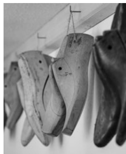
In der Herstellung ist jeder Schuh individuell, der Kunde kann Leder und Form aussuchen.

Handarbeit jährlich her. Empfohlen werden Schuhe für Männer ab 20 und Frauen ab 21 Jahren. „Davor könnte sich wachstumstechnisch noch zu viel ändern“, weiß Schwarz. Denn einen Goiserer, den hat man (fast) ein Leben lang. Entscheidend ist die richtige Pflege. „Man sollte ihn nicht jeden Tag tragen, weil zur guten Pflege gehört auch einmal ein Tag Ruhe für den Schuh. Man muss wissen, dass Leder ein Naturprodukt ist.“ In der Herstellung ist jeder Schuh individuell, der Kunde kann sich Leder und Form aussuchen. Ein normaler Halbschuh benötigt 25 Arbeitsstunden, einen Bergschuh fertigt Schwarz in 25 bis 35 Stunden. Die Zwienacht könne man eben nur per Hand machen und das brauche Sorgfalt und Zeit. „Ich mache aber auch feine Damen- oder Herrenschuhe. Ein Budapester oder Oxford mit Lochung per Hand bedarf aber auch 50 bis 60 Arbeitsstunden. Dem hochwertigen Handwerk entsprechend sind auch die Kosten. „Bei 1.200 Euro geht’s los“, sagt Schwarz. Das mag auf den ersten Blick verschrecken, aber wenn man an die Nachhaltigkeit des Schuhwerks denkt, muss man die Wirtschaftlichkeit nicht in Frage stellen. Und der mit Eisen beschlagene Goiserer, wird der auch noch gefertigt? „Drei davon habe ich für Holzknechte gemacht, ja. Aber die Nachfrage ist sehr gering, weil sie schon beim Sitzen im Traktor wieder zu rutschig sind. Eigentlich sind sie im Vergleich zu den Gummisohlen von heute nicht mehr alltagstauglich.“