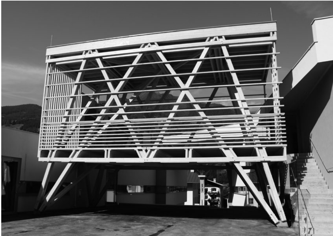
Die Freiklasse der Volksschule Bad Hofgastein

„Fortbildung ist der Schlüssel für die Zukunft.“