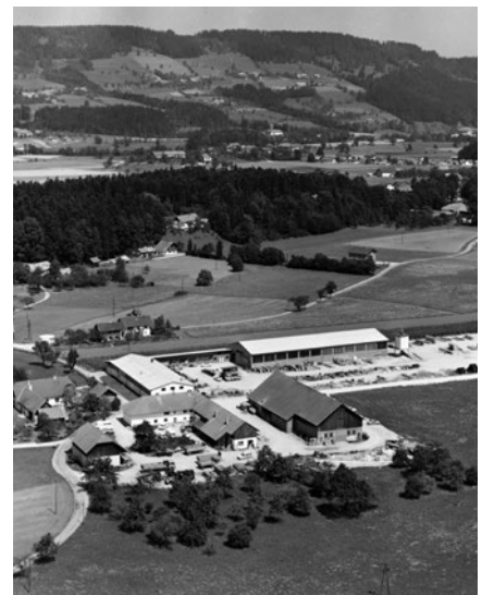
In Scharnstein begann 1966 die Erfolgsgeschichte der WOLF-Gruppe.