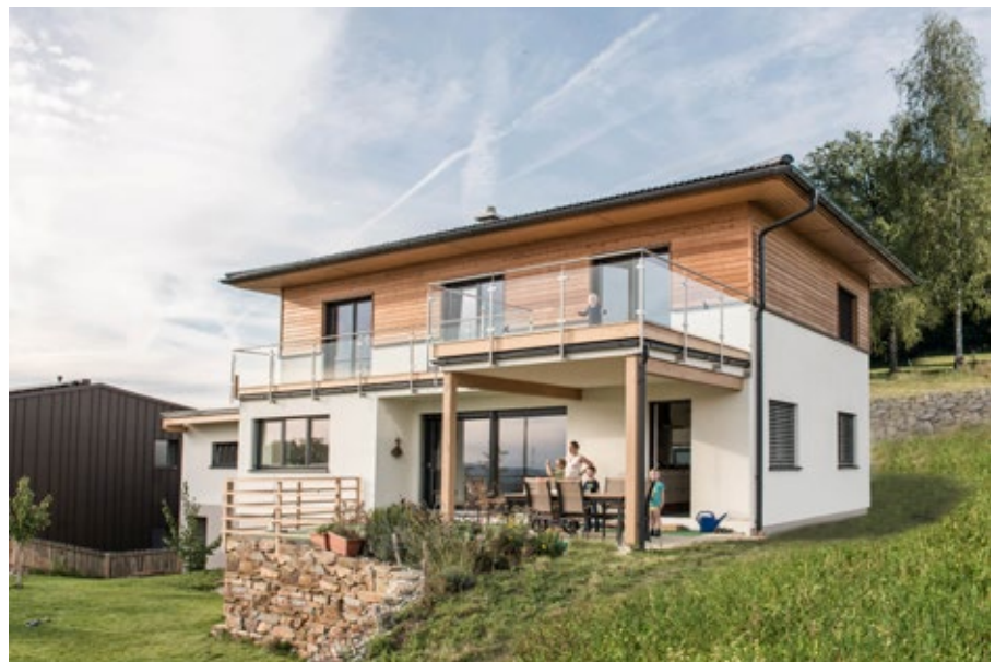
Wolf baut 650 Fertighäuser im Jahr.

ist Geschäftsführer der Wolf Systembau GmbH, die Teil der WOLF-Gruppe ist.