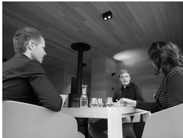
Expertentalk in exklusiver Umgebung: die innen wie außen in Holz gehaltenen Lofts von SEE31.

AIGNER: Eigentlich ja. Denn gerade Bauträger haben ohnehin ganz klare Vorgaben, wie viele Einheiten entstehen müssen, und benötigen Planungssicherheit. Übrigens hat der Holzbau in diesem Bereich