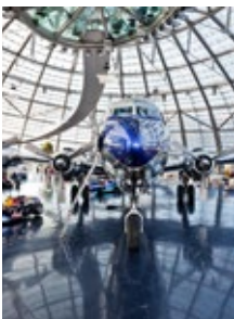
Kernstück der Sammlung: Eine Douglas DC-6B.