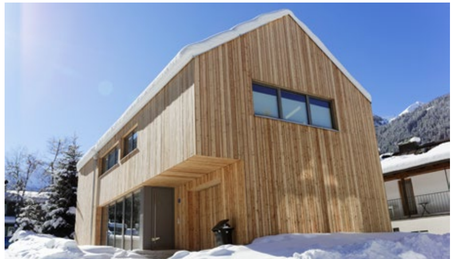
Das Wohnhaus Pichler besticht durch seine von außen sichtbaren Holzelemente.