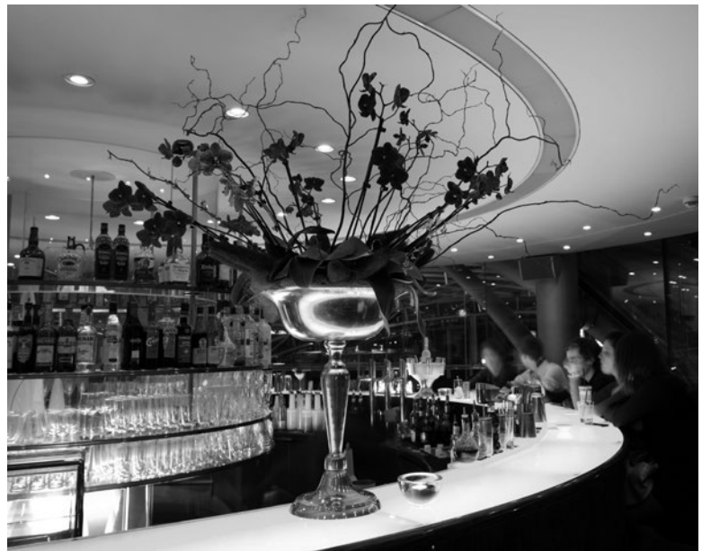
Boliden und Fluggeräte (oben) sowie exklusive Gastronomie und Geselligkeit (unten) – der Hangar-7 bietet beides.

Die Logistik ist auch ein gutes Stichwort für den Hangar-8. 8? Ja, 8. Direkt gegenüber des Hangar-7 steht ein weiteres imposantes Gebäude, das dafür sorgt, dass die Flugzeugflotte der Flying Bulls in ihrer vollen Pracht erhalten bleibt. Eine moderne Flugzeugwerft für die Wartung der historischen Objekte. Welche das eigentlich sind? Zum Beispiel eine Douglas DC-6B, die einst dem jugoslawischen Staatspräsidenten Tito gehörte. Oder sieben – davon vier flugfähige – demilitarisierte Alpha-Jets, welche bei vielen Flugshows mit spektakulärer Aerobatik im Einsatz sind. Oder Hubschrauber wie der einzige zivil zugelassene amerikanische Kampfhubschrauber vom Typ Bell TAH-1F Cobra. Aber wer es genau wissen will, der besucht den Hangar-7 selbst. Und darf sich freuen: Der Eintritt ins Flugzeugmuseum der imposanten Art ist kostenlos. Das gesparte Geld braucht es aber ohnehin – zumindest dann, wenn man anschließend im Ikarus speisen möchte.