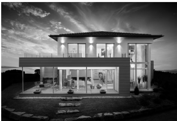
Die Griffner-Architektur ist modern, das Innenleben auch.

Und das ist der Unternehmenssitz des Fertighausbauers Griffner, der ausschließlich in Holzriegelbauweise fertigt. Ein Unternehmen, das eigentlich viel bekannter ist als die Marktgemeinde selbst.