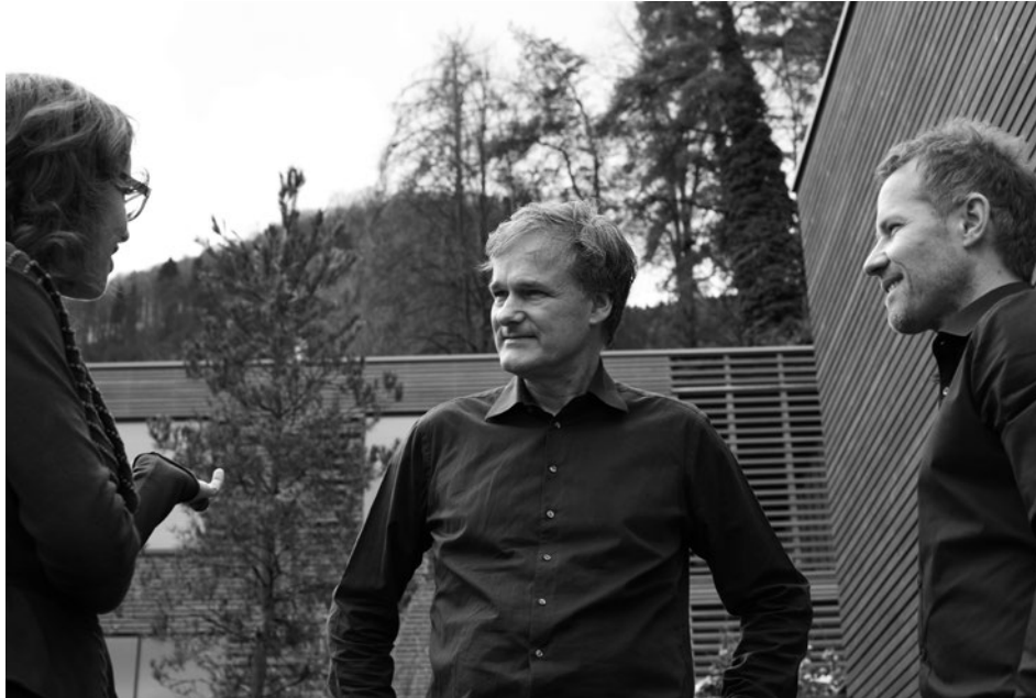
Ruhe und Natur – der Hintergrund zeigt, wie gut sich die SEE31-Lofts in die Umgebung einfügen

auch deshalb stets einen Vorteil gegenüber anderen Bauweisen, weil man aufgrund der schlankeren Wände mehr Quadratmeter schaffen kann.