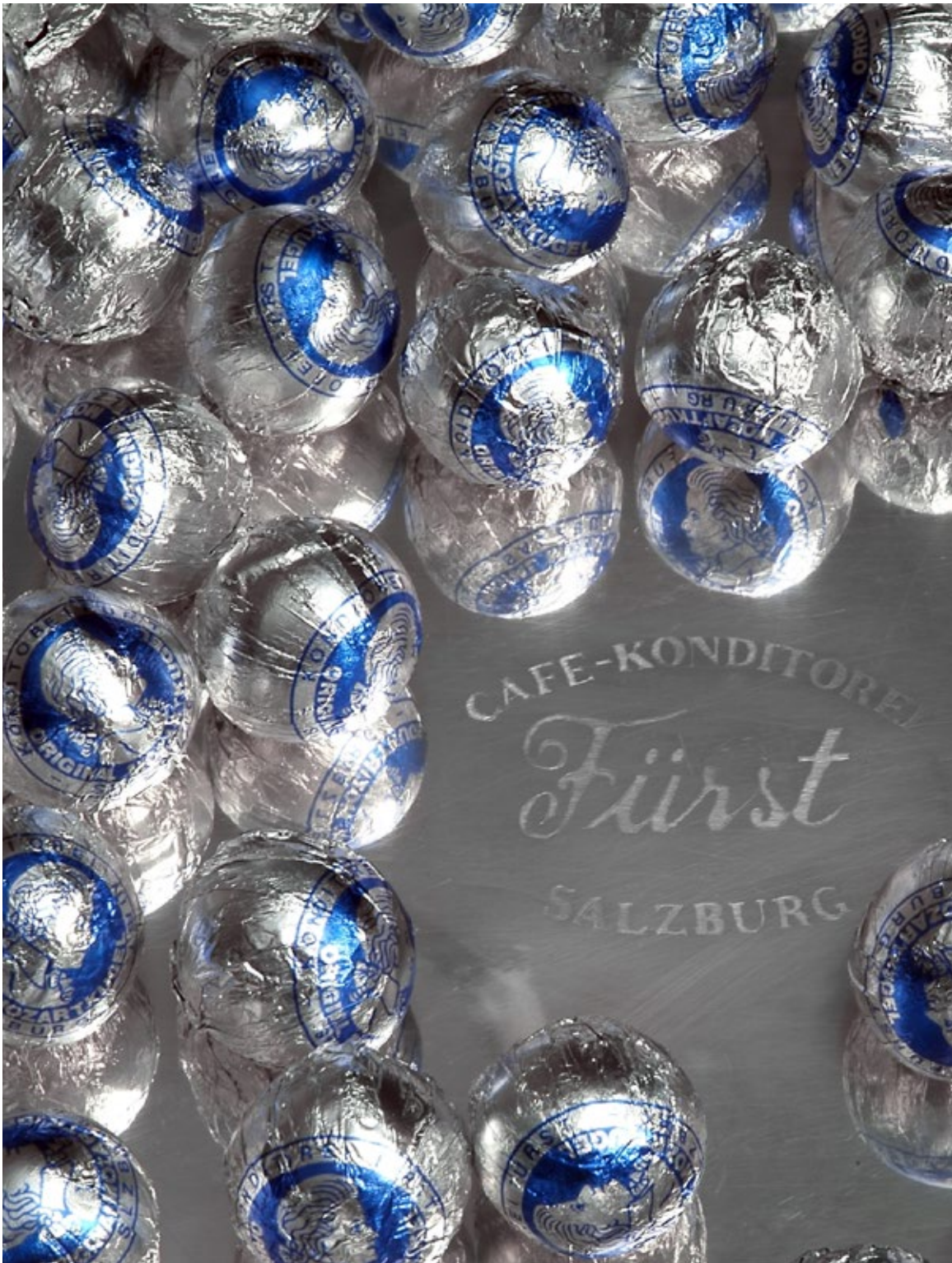
Das Original ist auch an seiner Verpackung erkennbar: Der Fürst-Mozart blickt nach rechts.