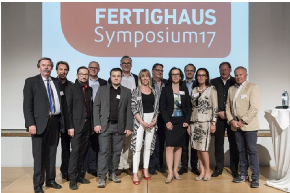
Beim Fertighaus Symposium 2017 traf sich das Who is Who der Branche.