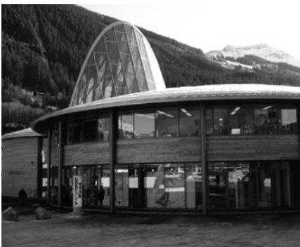
Skizentrum Angertal, Bad Hofgastein