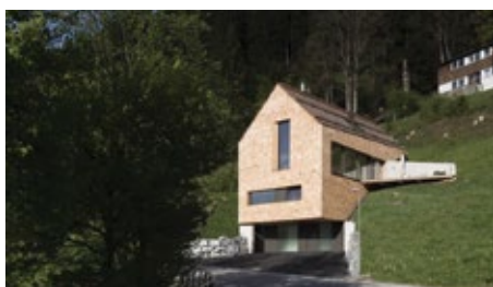
Eggers Projekt „Haus Jauernik“ erhielt eine Anerkennung beim Holzbaupreis Salzburg 2015.

Die Grundlage ist, dass wir wissen, dass Holzhäuser in der Praxis einen wesentlich besseren Dämmwert haben, als es die Berechnungen der Energieausweise sagen. Das wissen wir einerseits aus Erfahrung und andererseits deshalb, weil wir bei Feldversuchen und bei Gebäuden, die in Holz gebaut werden, den Energieverbrauch aufgrund von Fernwärmeanschlüssen kontrollieren können. Und zwar sehr exakt. Wir wissen, dass wir durchwegs um 35 Prozent unter dem Wert des Energieausweises liegen. Diesen Fakten wollten wir auf den Grund gehen.