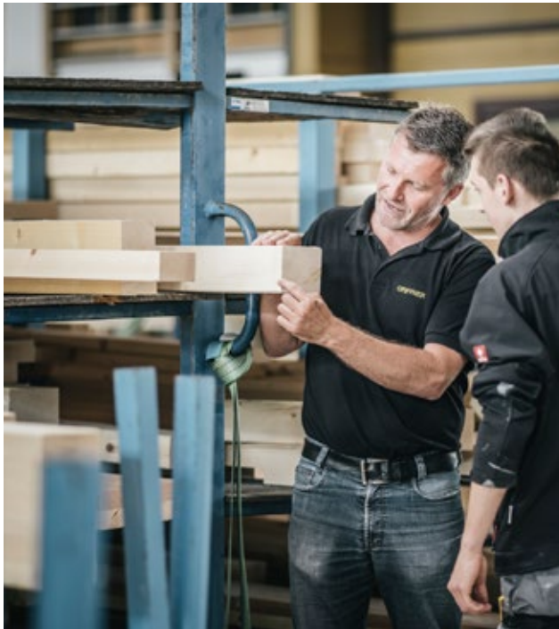
Auch in der Vorfertigung setzt Griffner auf Premiumqualität.

Die Entscheidung für ISOCELL und gegen Mitbewerber fiel aber auch aus technologischen Gründen. „Wir bekommen so die beste Performance.“