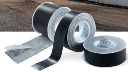
OMEGA UVKB Fassadenband