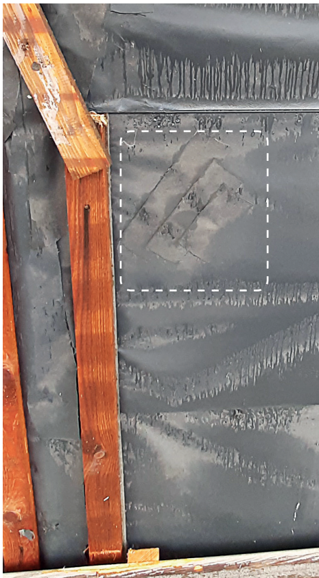
Reparaturstellen (überlappende Bänder) Alles dicht – auch an dieser Stelle!

Stehende Kanten sollten vermieden werden, haben aber der Belastung durch schadhafte Schalung standgehalten.