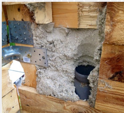
Celuloza, nameščena za izolacijo v zunanje in vmesne stene ni kazala znakov posedanja ali deformacij.