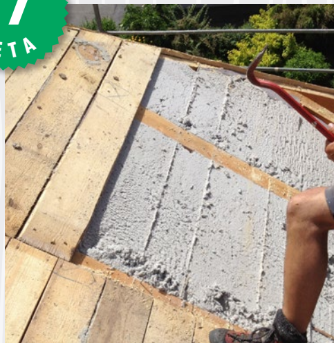
Po 17 letih odprto strešni stol (hiša na tirolskem) Celuloza ISOCELL se zdi, kot bi bila vpihana na novo