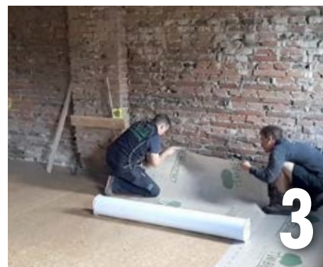
Détacher le liner au début du rouleau et fixer TIMBER PROTECT