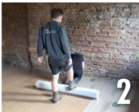
puis enrouler à nouveau proprement