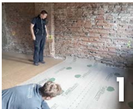
Dérouler et ajuster TIMBER PROTECT