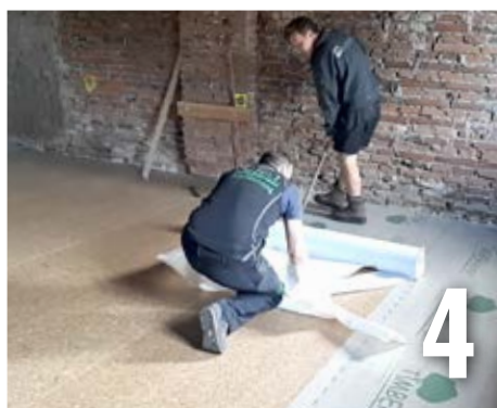
Retirer le liner. ATTENTION : le rouleau doit être déroulé à plat au sol pendant que le liner est retiré.