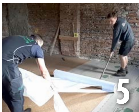
La membrane doit être parallèlement pressée de façon lisse au moyen d'une raclette. Toujours vers l'extrémité de la membrane pour empêcher les bulles d'air et les plis.