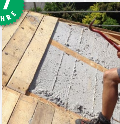
Nach 17 Jahre geöffneter Dachstuhl (EFH Tirol). Die ISOCELL Zellulose wirkt wie frisch eingeblasen.